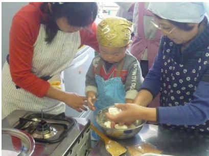
お母さんといっしょにコネコネとおから餅づくり

11月10日(水)、若槻コミュニティセンターでコミわかグリーン倶楽部主催の「収穫を楽しむ会」が開催され、農園利用者など約30人の参加がありました。