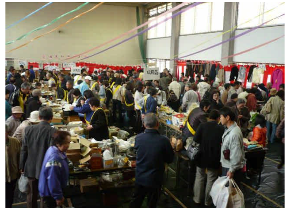
良い物ないかと人混みの中を掻き分けて

ご協力いただいた地区の皆様、また協力店の皆様には心から感謝を申し上げます。バザー収益金は福祉活動に活用してまいります。