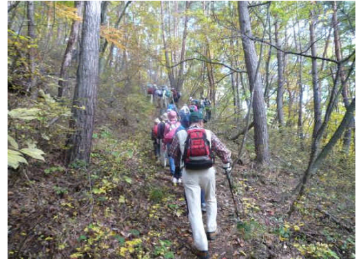
晴天に恵まれた秋のトレッキング

キノコの時期には遅くて残念でしたが、最近トレッキングは若い女性にも人気があり、史跡を見学しながら爽やかな秋の一日を楽しみました。