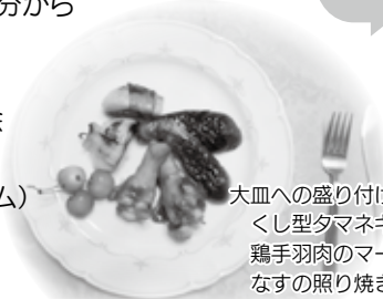
大皿への盛り付け くし型タマネギのベーコン巻き 鶏手羽肉のマーメレード煮 なすの照り焼き