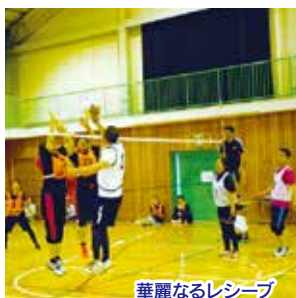
華麗なるレシーブ

5月19日(日)に地区公民館対抗の春季スポーツ大会が若槻小学校で開催されました。参加チームは計25チーム、応援も含め397人が参加し、さわやかな5月の青空の下で、熱戦を繰り広げました。ソフトバレーボールは2セットマッチ(同点はじゃんけん)から勝負がつく3セットマッチにルール変更し、ソフトボールは柔らかいボールと子供用バットを採用し飛球を抑える工夫をしたこともあり、力の入った素晴らしい試合が展開されました。小さなお子様のほほえましい応援、各地区での昼食タイムでの笑顔もあり、地区間や区の仲間の交流も図れ、楽しい一日でした。入賞チーム等は、表の通りです。(公民館部会)