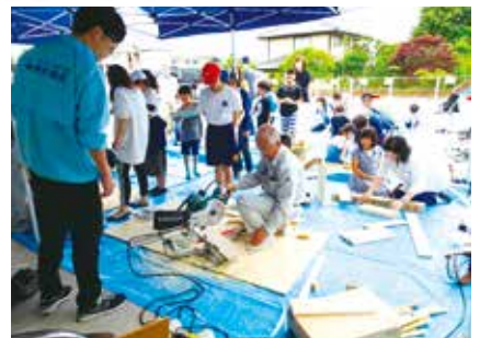
大人気のフリー木工

プラスチック粘土、フリー木工、ステンドグラス風プレート、むにゅむにゅ風船、バルーンアート、割り箸あそび、ミラクルしゃぼん玉の7つのブースで、時間内にいくつものブースを回って楽しむ子どもがいたり、気に入ったブースの整理券を何度も