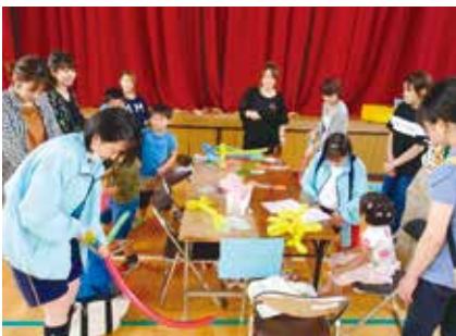
北部中学生のバルーンアート

7月7日(日)に若槻コミュニティセンターにて、「チャレンジ!わかつきジュニア体験広場」が開催されました。今年もたくさんのお子様たち・保護者の参加がありました。