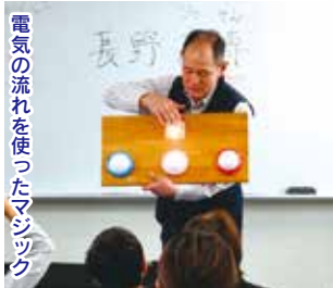
電気の流れを使ったマジック

参加者から「勉強になったし楽しかった」「さらに理科に興味を持った」と大変喜んでいました。最後にポップコーン・お菓子・ジュースなどのおやつを沢山もらって楽しそうに帰りました。子どもたちが楽しみながら理科を体験できる「子ども科学体験教室」に来年もぜひ親子でご参加ください。(青少年部会)