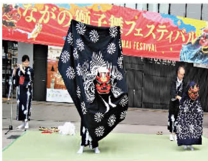
長野駅前広場 諏訪神社徳間神楽保存会

若槻地区からは「諏訪神社徳間神楽保存会」「徳間八幡神社神楽保存会」の2団体が参加、獅子舞を披露し観客からは盛大な拍手が送られました。