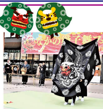
長野駅前広場 徳間八幡神社神楽保存会