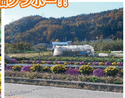
荒瀬原線沿いの菊畑 11月12日撮影