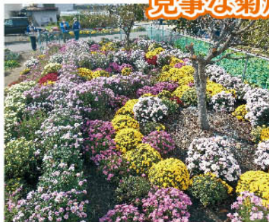
東条の菊畑 10月26日撮影