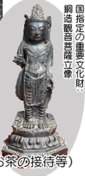
国指定の重要文化財 銅造観音菩薩立像