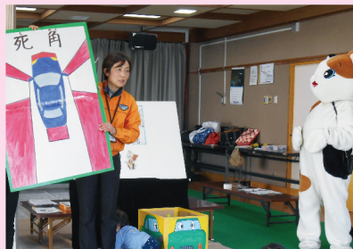
保護者に聞いてもらいたい 「車の死角」のはなし(交通安全:3月予定)

1月26日(金) 保育士さんとあそぼう 2月16日(金) 保健師さんとあそぼう 3月22日(金) 楽しく交通安全