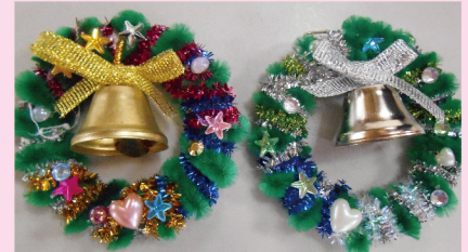
12月の工作はブローチを作りました

＊読み聞かせメンバーが来てくれた子どもさんに合わせて絵本を選びます。抱っここの赤ちゃんや2人、3人連れての参加でも一緒に楽しめますよ♪