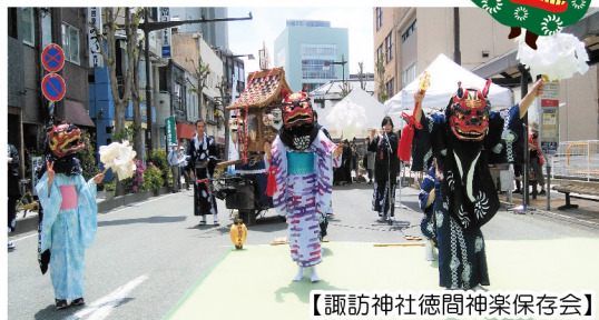
【諏訪神社徳間神楽保存会】