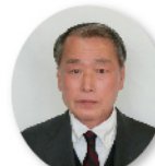
福祉健康部長 山室 光宣