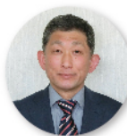
生活安全部長 八木 和久