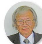
教育文化部長 市野川 浩