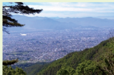
ビューポイントから市街地を望む

② 三登山・山城コース (約8km 6時間) 山城跡、ビューポイント、三登山山頂、山千寺を巡る 持ち物: 昼食、飲み物、雨具 注意点: コースには急坂などもあります。体力に不安のある方は参加をご遠慮ください。