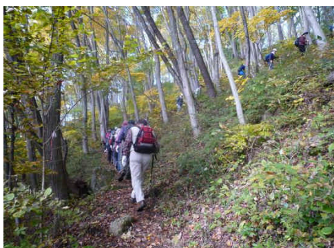
好天に恵まれたトレッキング

11月7日(日)、三登山から髻山を巡る秋のトレッキング大会が開催されました。好天にも恵まれ79名(地区外33名を含む)の老若男女が参加しました。