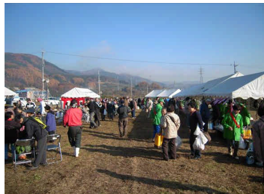
新鮮な野菜をいっぱい抱えた買い物客

今回は「三登山太鼓」の生演奏で、一段とお祭り度がアップ、盛大に行われました。地産地消、食育、グリーンツーリズム、農業問題等、抱える問題は多いけれど、まずは地域の人との交流、活性化を目的にこの「収穫祭」を続けたいと思います。