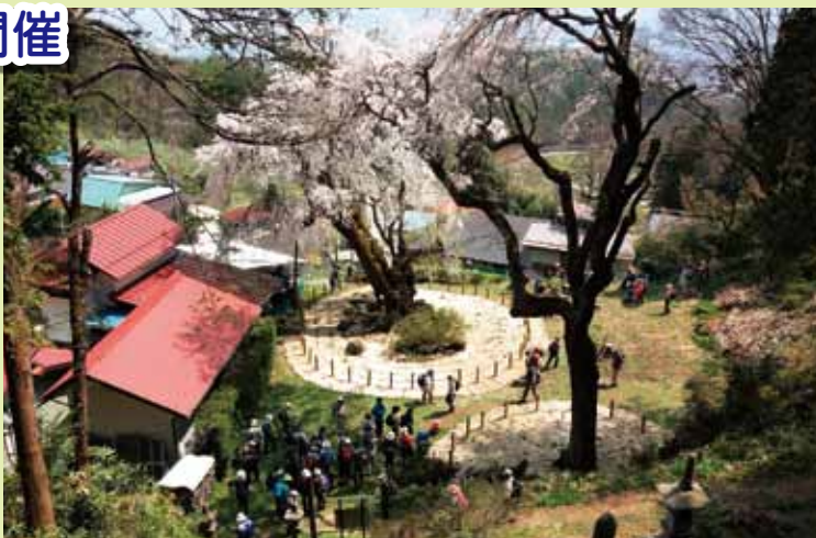
満開の信玄駒つなぎの桜(山千寺観音堂から)

4月27日(日)に、長野市内外から大勢の方の参加をいただき、楽しく出来ました。若槻地区からは39名、地区外からは98名の方の参加があり、特に千曲市、須坂市、松代、川中島等遠方からの参加が多数ありました。三登山トレッキングコース愛護会では、これからも安全に登れるコース整備を行っていきます。整備等に興味をお持ちの方の愛護会への会員加入も募集しております。