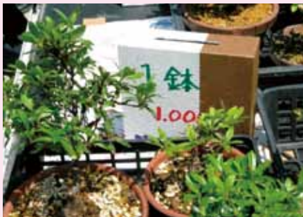
こんなに立派な鉢です。ありがとうございました。

素晴らしい“さつきの鉢”をたくさんいただいたことから、今回、交換会に合わせて一鉢 1,000 円で寄付を募り「桜ライン 311」（陸前高田の津波到達点上に桜を植樹し、震災を後世に伝えるためのプロジェクト）に役立ててもらおうと考えました。花の交換会と花つながりということで皆様にもより身近に感じてもらえるのではないのでしょうか。この2日間で 11,000 円ものまごころをいただきました。ありがとうございました。