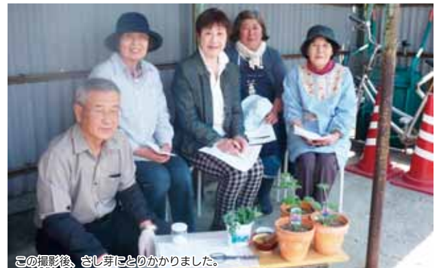
この撮影後、さし芽にとりかかりました。

5月8日に行われた鑑賞菊の講習会は、アットホームな雰囲気の中、楽しくさし芽を教わりました。今後が楽しみです。