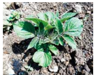
中身も紫色のじゃがいもです。

第2ボランティア室の南側にじゃがいもを植えました。植えてから雨が少なかったので心配していましたがめでたく発芽。これからも成長記録を載せますので楽しみに。