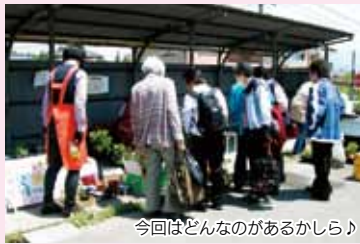
今回はどんなのがあるかしら♪

今回は連休の関係で5月8・9日の2日間に行われました。大勢の皆さんのごいてくださってにぎやかな雰囲気の中、終了となりました。