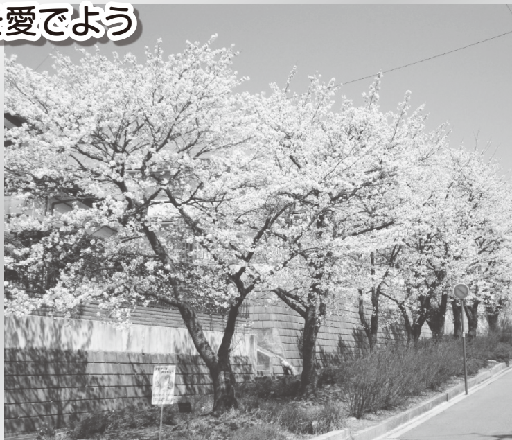
満開を迎えたグリーンベルトの桜並木 (上野3丁目)