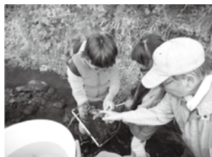
これなーに？これはシジミだね。ヤマトシジミというんだよ。