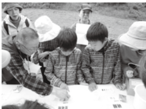
ホタルはきれいな川に住んでるんだって？まず川の水を調べてみよう！とバックテストに挑戦！