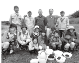
さわガニ、カワニナ、トンボのヤゴ、トビケラなども沢山いたよ。友達がたくさんいるからホタル(幼虫)はさびしくないんだね。観察を終えて、みんな川に帰してあげました。