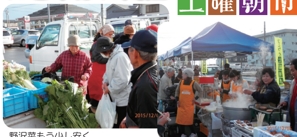
野菜ももう少し安く ならないの?