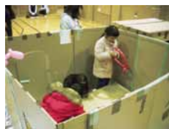
段ボールの家では壁に自由に落書き

[お詫びと訂正] 1月1日発行の新年号(第67号)の冒頭の俳句で「初東風や宮に眠れる神馬かな」とありますが、「初東風の宮に眠れる神馬かな」が正しく、お詫びして訂正申し上げます。