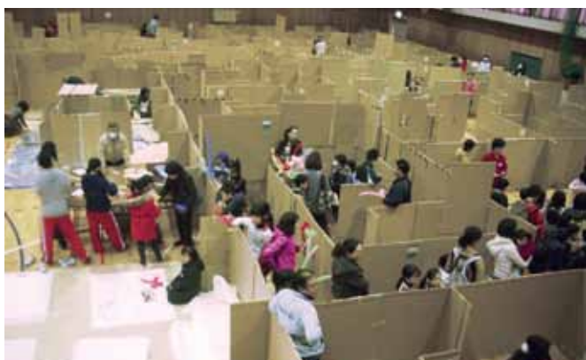
体育館に広がる“オモシロ迷路”