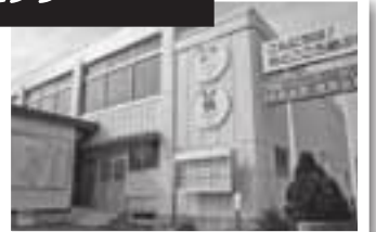
若槻コミュニティセンター