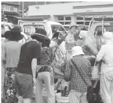
8月11日(金) お花市風景

なお、21日(土)からは新米が売り出されます。当日は福祉部会が行う包丁研ぎのイベントもあります。今年ではあと11月4日(土)、11月18日(土)、12月2日(土)にあります。(コミわか土曜朝市の会)