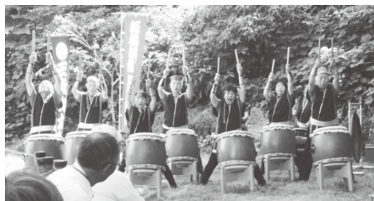
(山千寺史跡保存会)

住民自治協議会の皆様、三登山太鼓の皆様、山千寺地区の皆様、すべての御来席の皆様にご感謝申し上げます。