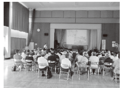
防災研修会(信大出前講座)