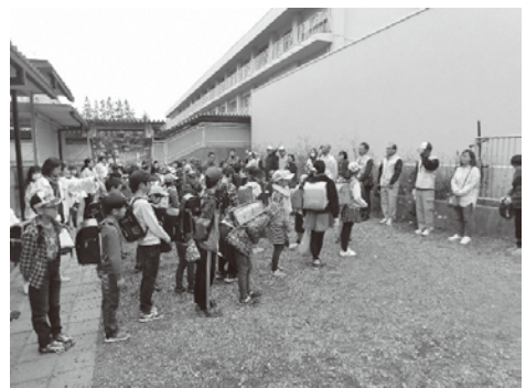
歩いて見守るパトロール出発式