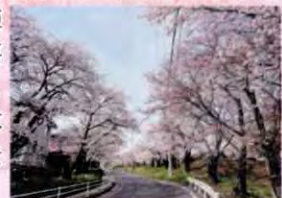
10 山千寺の信玄コマツなぎの桜

徳間から急なカーブをいくつか上ってくると最後のカーブから桜のトンネルが迎えてくれます。誰もが思わず息を止め、車の速度を落とします。一度見た方は強烈な印象を忘れません。