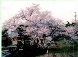
b 明治天皇御小休所の桜