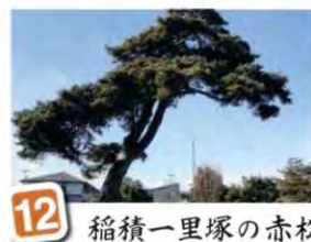
12 稲積一里塚の赤松

4月中旬山千寺の境内一帯は紅紫の色に染まります。可憐な花を眺じらうかのようにうつむき加減に咲かせる春の妖精カタクリの群生です。