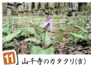
11 山千寺のカタクリ(吉)

4月中旬山千寺の境内一帯は紅紫の色に染まります。可憐な花を眺じらうかのようにうつむき加減に咲かせる春の妖精カタクリの群生です。