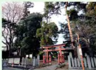
e 徳間諏訪神社境内